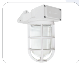
Branco N 9.5

Fabricada nas seguintes cores pelo código Munsell: