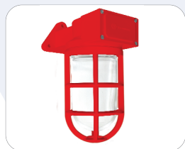
Vermelho Segurança 5 R 4/14